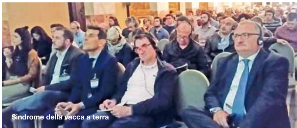
Sindrome della vacca a terra

Un altro argomento affrontato è stato quello dei baliaggi: i criteri di scelta della balia ideale e, a seguire, è stato illustrato come può essere eseguito lo svezzamento precoce dei suinetti provenienti dalle balie con riferimento sia all'alimentazione che all'ambiente ideale.